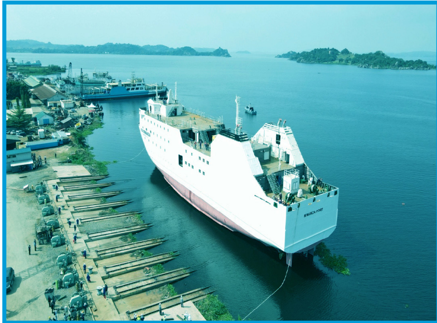
Meli mpya ya MV. Mwanza “Hapa kazi Tu’ inayojengwa katika Bandari ya Mwanza Kusini jijini Mwanza. Meli hiyo itakapokamilika itakuwa na uwezo wa kubeba Abiria 1200 na Mizigo tani 600.