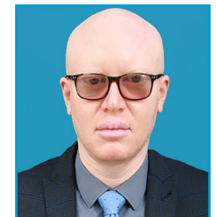
DKT. ALLY S. POSSI NAIBU KATIBU MKUU SEKTA UCHUKUZI