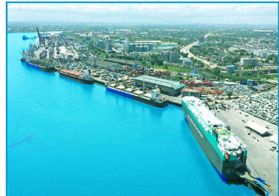
Meli kubwa zaidi ya magari kuwahi kupokelewa Bandari ya Dar es Salaam. Meli hii ilitia nanga tarehe 8 Aprili, 2022 ikiwa imebeba jumla ya magari 4,041 ambapo magari 2,936 yalikuwa ya nchi jirani.