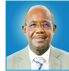
MHE. PROF. MAKAME M. MBARAWA (Mb.) WAZIRI WA UJENZI NA UCHUKUZI