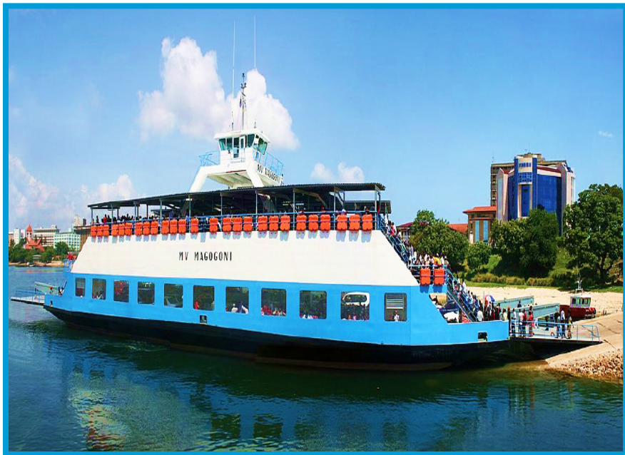
Muonekano wa Kivuko cha Mv Magogoni, Jijini Dar es salaam