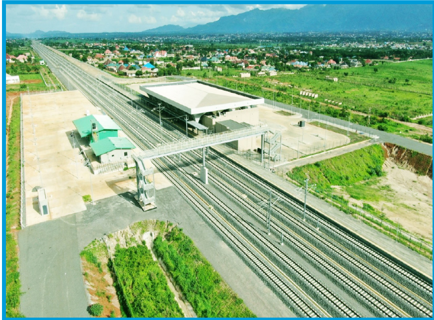
Muonekano wa moja ya kituo cha Reli ya Kisasa (SGR) Sehemu ya Dar es Salaam- Morogoro (km 300) ambao ujenzi wake umefikia asilimia 97.