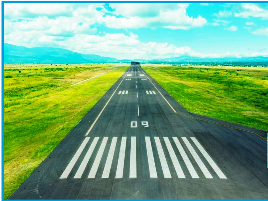
Barabara ya kuruka na kutua ndege kiwanja cha Ndege katika cha Songwe-Mbeya.