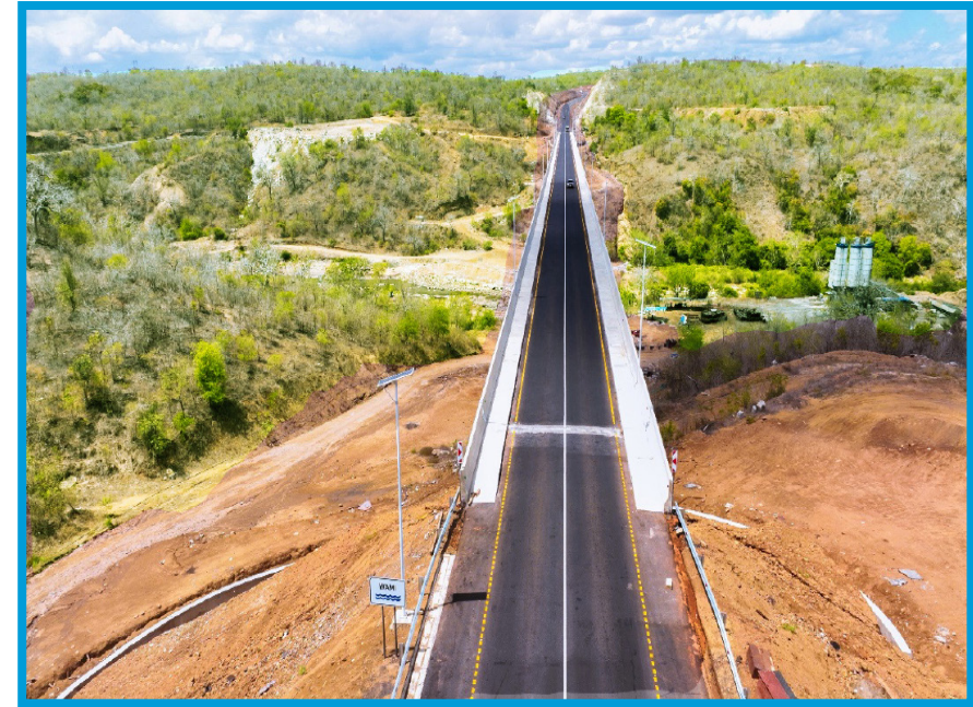
Muonekano wa Daraja la Mto Wami.