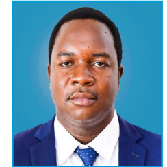
MHE. ATUPELE F. MWAKIBETE (Mb.) NAIBU WAZIRI WA UCHUKUZI